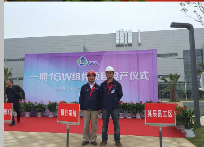
出席仪式的各方领导