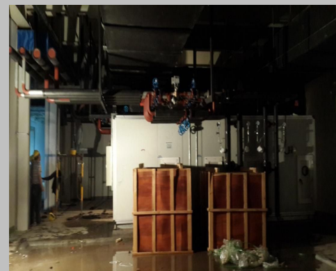
施工现场地面积水较多